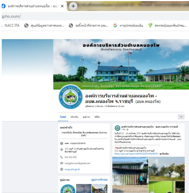
เพจ Facebook : อบต.หนองโพ